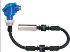
Sensor 3 Nivells

Dipòsits de gasoil. Recuperació d'hidrocarburs. Pilots de senyalització. Equipat amb sensor especial de 3 nivells. Sortida alarma tipus relé. Avisador acústic. Alarma de nivell mínim i nivell màxim.