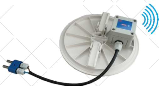
Instal·lació del sensor R23KDE2 en la tapa del skimmer de la piscina.